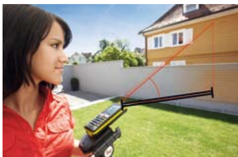
Determine la distancia horizontal, incluso con obstáculos, por medio del sensor de inclinación.