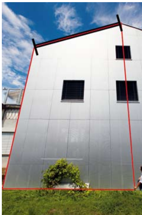
La función trapezoidal facilita la medición de inclinación de techos.