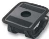
Soporte para el brazo Nº. art. 739 200 Pocket PC: libertad de movimiento mientras trabaja con Leica DISTO™ D8, Leica DISTO™ D3 a BT y D8