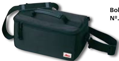
Bolsa Nº. art. 667 169