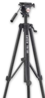
Trípode Leica TRI 100 Nº. art. 757 938 Trípode de calidad con ajuste fino de gran sencillez