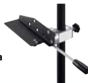
Adaptador para fijación al bastón Nº. art. 769 459