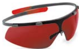
GLB30 Gafas ligeras Nº. art. 780 117 3 en 1 para ver el punto láser con tres tipos diferentes de gafas: para ver el punto láser, de seguridad y para el sol